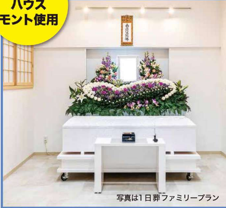
写真は1日葬ファミリープラン