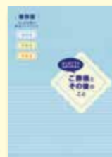
終活ハンドブック