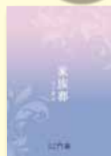
家族葬の詳しい資料