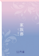
家族葬の 詳しい資料