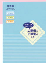
終活 ハンドブック